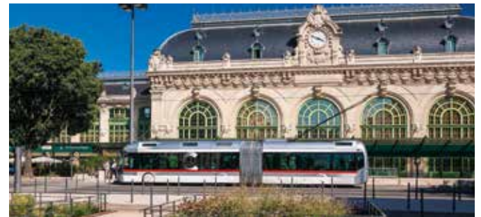
Ligne de Bus C (service renforcé), ancienne gare des Brotteaux.