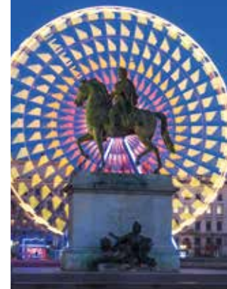
Grande Roue, place Bellecour.