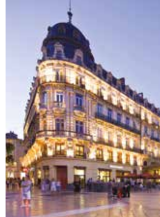
Montpellier, place de la Comédie