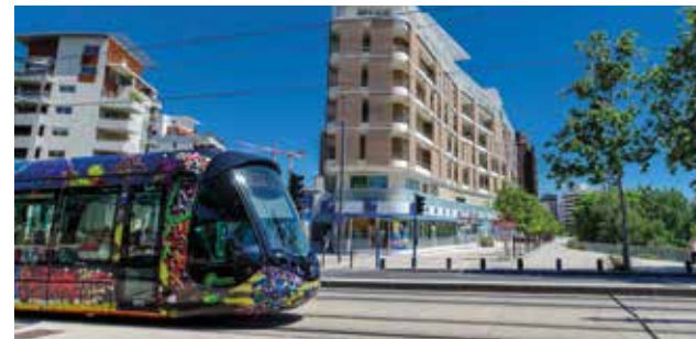
Tramway, quartier de Port Marianne, avenue Marie de Montpellier